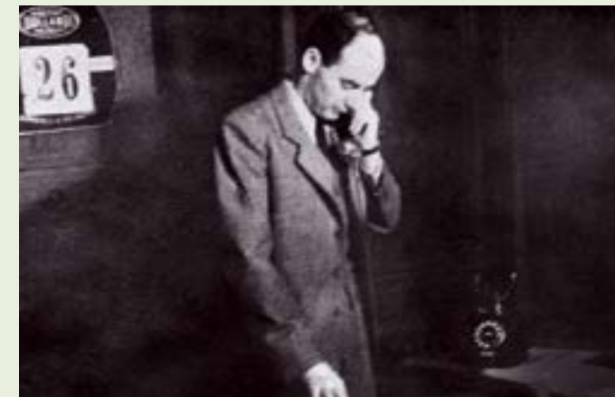
Att hylla Raoul Wallenbergs gärning kan bidra till djupare vänskap och närmare relationer mellan Sverige och Israel.

Den som ger 1 200 kr till Raoul Wallenberg-parken får, förutom ett jubileumsdiplom, även pocketversion av journalisten Ingrid Carlbergs bok "Det står ett rum här och väntar på dig ...", som är en