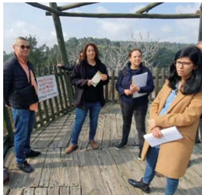
Utsiktsplatsen vid T'sora-skogen i närheten av Bet Shemesh där Raoul Wallenberg ska hedras.