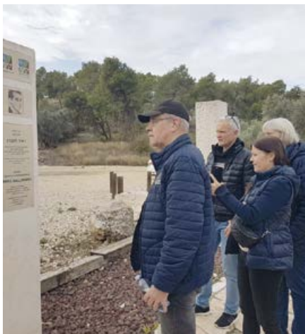
Delegation från Livets Ord besöker området som ska bli Raoul Wallenberg Park.

I mina dagliga dialoger med människor runtom i Sverige kan jag känna att det finns hopp om en omsvängning vad gäller hur man ser på Israel. En ny, positivare hållning växer sakta fram. Tillströmningen till Vänskapsförbundet Sverige Israel är