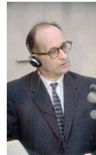
Adolf Eichmann, Raoul Wallenbergs antagonist i Budapest, fångades i Argentina av israeliska säkerhetstjänsten och dömdes till döden vid en rättegång i Jerusalem i början av 1960-talet.

Staffan Söderblom blev sedan den som i egenskap av ambassadör i Moskva på ett ödesdigert möte med Stalin den 17 juni 1946 antagligen