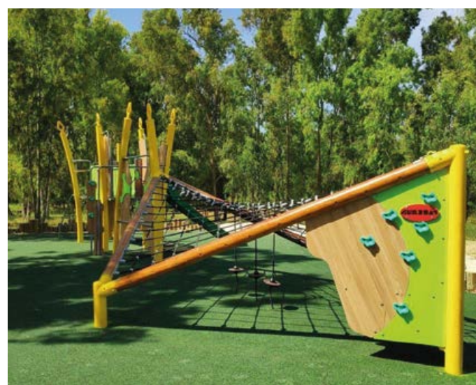
Lekplatsen i anslutning till Shokeda-skogen.

Använd inbetalningskortet på baksidan av denna folder för att ge din gåva. Du kan även ge via Swish-nummer 123 683 76 78 eller bankgiro 5816-5515. Märk betalningen "Raoul Wallenberg". □