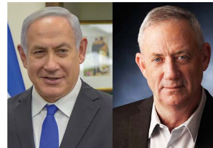
Efter tre val bildade Benjamin Netanyahu och Benny Gantz en samlingsregering.