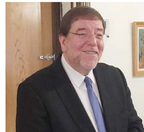
Ambassadör Ilan Ben-Dov och Sveriges nya utrikesminister Ann Linde ska träffas.