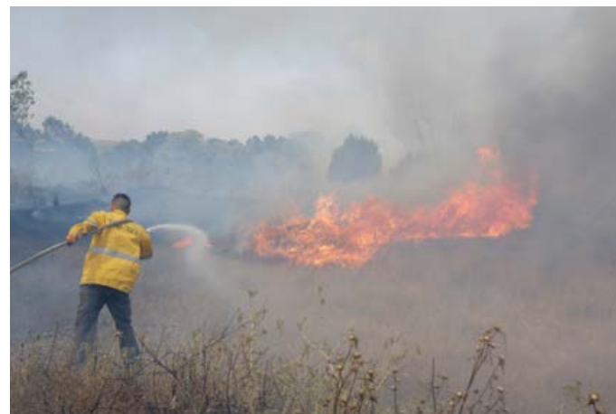
Drygt 100 brandsoldater arbetade i veckor för att bekämpa över 1000 bränder som startat på två dygn.