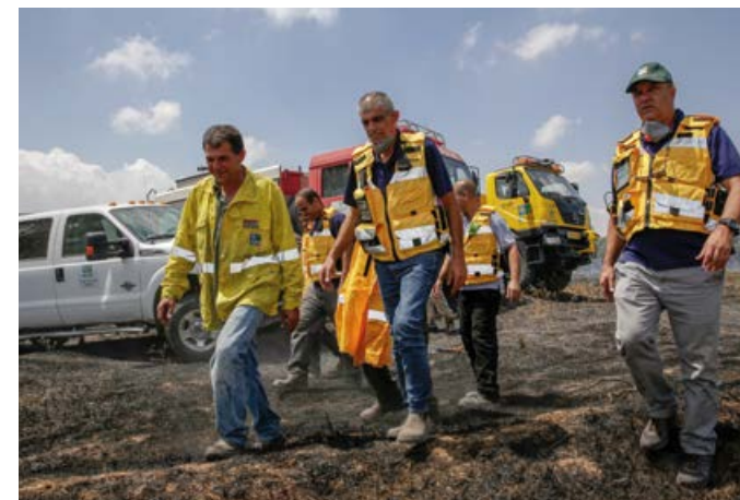
I anslutning till Israels 70-årsjubileum förra året inleddes en våg av pyromandåd från Gaza mot södra Israel. I samband med Melodifestivalen i år drabbades Israel återigen av en ny våg av bränder.