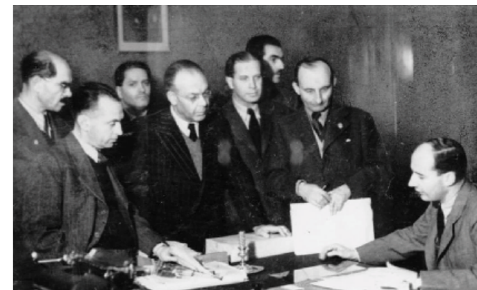
Raoul Wallenberg tillsammans med sina medarbetare i Budapest.

Parken ska uppmärksamma den svenska diplomatens osjälviska insats för att i svenska UD:s namn rädda tusentals judar från Förntelsen. En lista över alla donatorer kommer att förvaras i Jerusalem i en särskild hyllningsbok till Raul Wallenbergs minne.