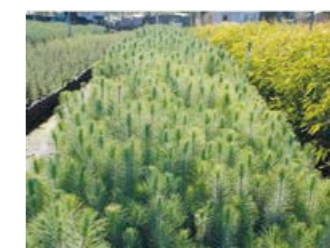
Plantor som vuxit till sig.

Äntligen framme på plantskolorna är det dags att behandla fröna så att de öpp-