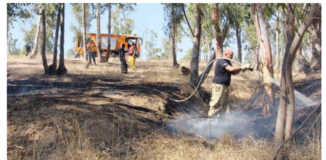
Brandbekämpning i Be'eri-skogen.

– Keren Kajemets personal har den unika fördelen att de är bekanta med skogens miljö. Vi har också brandbekämp-