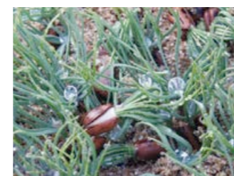
Frön som gro.

Det kan låta enkelt, att plantera ett träd. Det är att sätta en liten planta i jorden, vattna, och sedan bara vänta. Men i ett land som Israel, som till stor del är öken, och där inte vilken planta som helst överlever när det bara regnar några gånger om året, är förberedelsen av trädplantan en vetenskaplig konst.