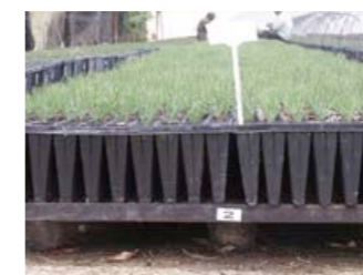
Plantor på tillväxt.

Kottarna förs till KKLs National Seed Center i Beit Nechemia där de värms upp