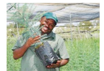
Planta redo för plantering.

Det säger sig självt att en liten planta inte kan planteras var som helst. Innan den kan sättas ut måste även marken