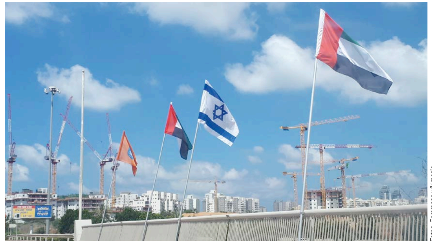
Israels och Förenade Arabemiratens flagga svajar på Israels motorväg 2 i augusti 2020.

De två länderna ska utbyta ambassadörer och upprätta ambassader. Avtalet