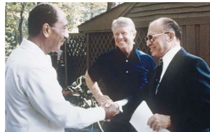
År 1978 slöt Egyptens president Anwar Sadat fred med Israels premiärminister Menachem Begin