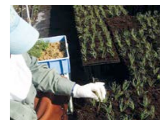
Frön som blivit små plantor.

KKLs arbete börjar bland de finaste barrträden i Israels skogar. Dessa väljs ut och registreras för sina egenskaper av motståndskraft mot torka, insekter och sjukdomar. Det är sådana egenskaper man vill föra vidare. Man återkommer därför år efter år till dessa utvalda träd för att hämta dess frön. Totalt sett utses träd från fler än 250 trädarter. Men nu tillbaka till vårt barrträd.