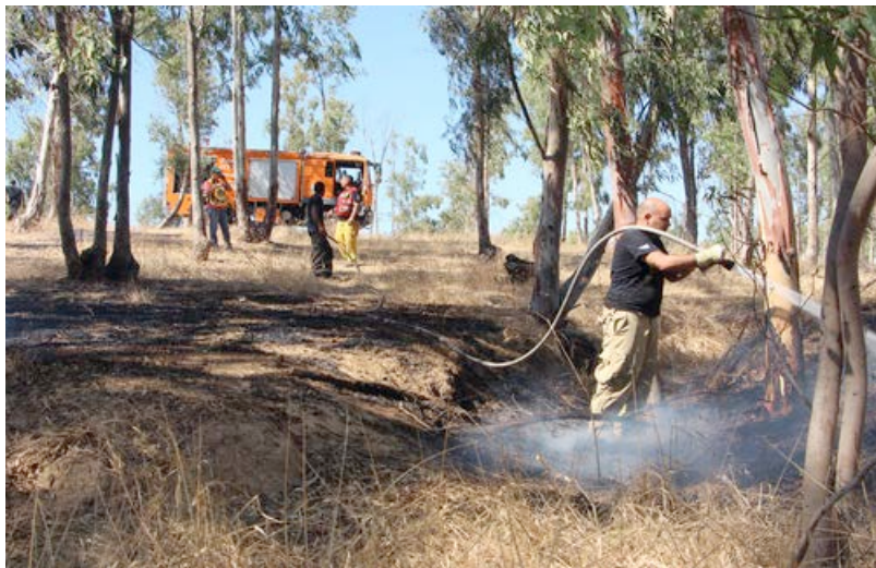
Mer än 500 bränder har förstört mycket av Keren Kajemets planteringar.

Till detta kommer det tidsmässiga perspektivet. Det tar 30 år innan ett träd