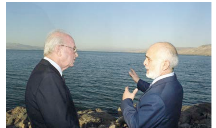
År 1994 undertecknade Israels premiärminister Yitzhak Rabin och Jordaniens kung Hussein ett fredsavtal.

ger även israeler möjligheter att flyga till Abu Dhabi och invånare i Förenade Arabemiraten att besöka Jerusalem och Tel Aviv.