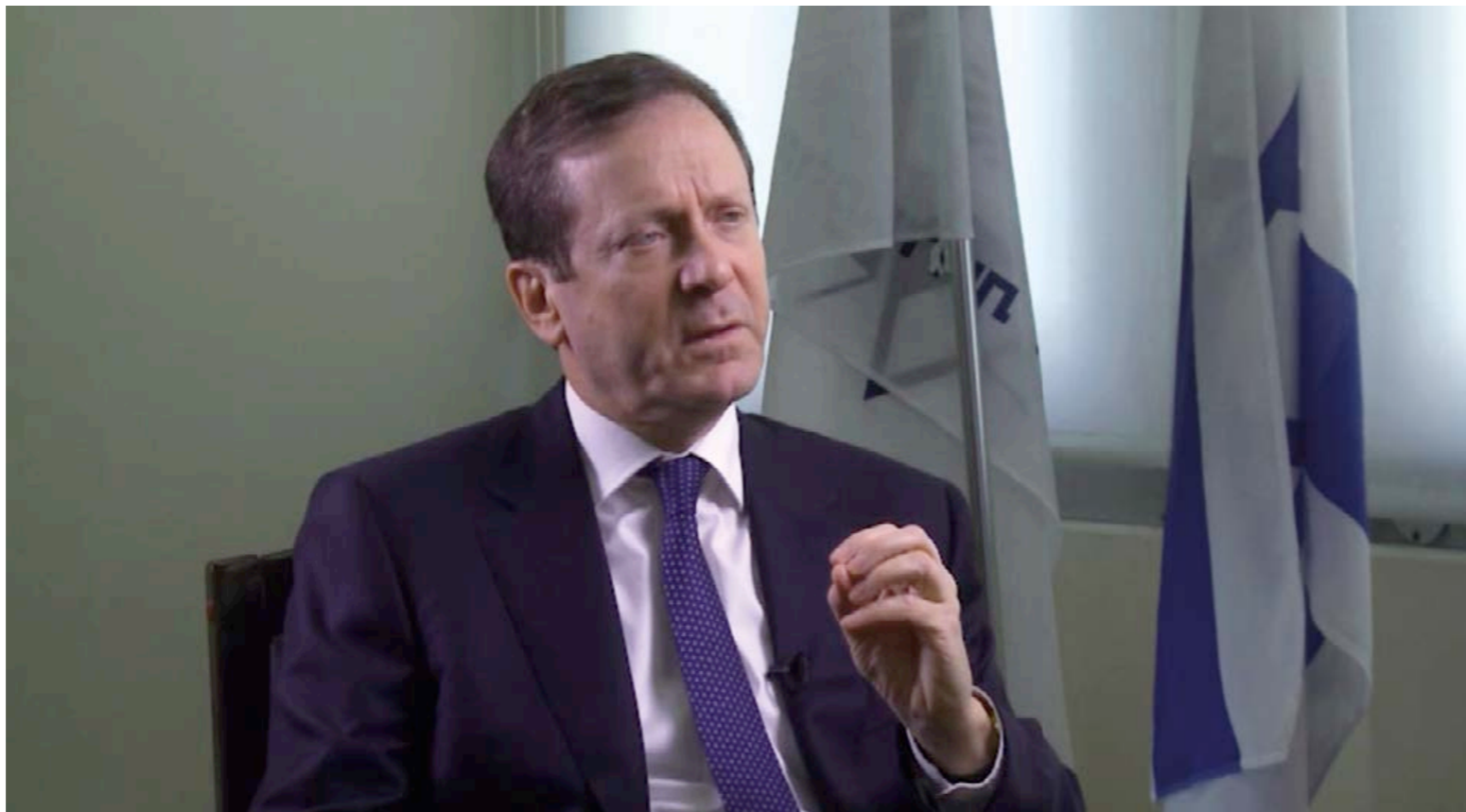
– Jewish Agency grundades år 1929 för att implementera beslutet från den 24 juli 1922 i Nationernas förbund (NF) om att skapa ett nationellt hem i landet Palestina, berättar organisationens världsordförande Isaac Herzog.

– Vi är verkligen störda över den ökande antisemitismen i Sverige. Det vi har sett i Malmö de senaste åren är en röd lampa. Jag är därför glad