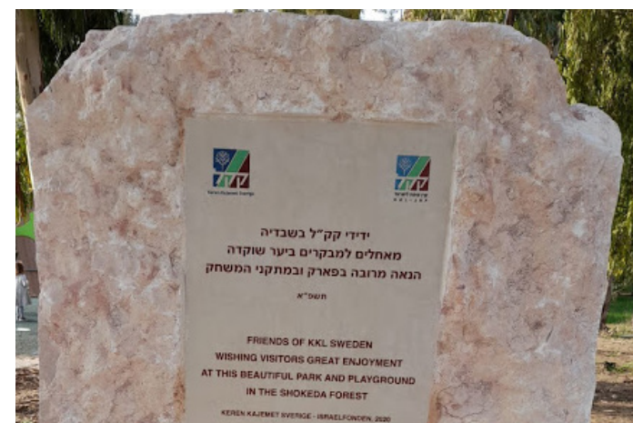
Svenska Keren Kajemet har tagit ett ansvar för att bygga den lekplats som har anlagts i anslutning till rekreationsplatsen i Shokeda.

Ett stort tack till alla understödare för ert bidrag till detta projekt. □