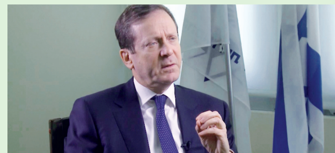
Isaac Herzog, världsordförande för Jewish Agency.

jare att bli involverade och bidra till detta unika projekt, fortsätter han och beskriver Sverige som ett viktigt land med ett stort inflytande i världen.