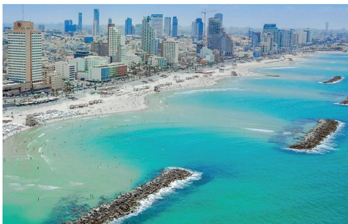
Turismen till Israel minskade med 81 procent förra året.