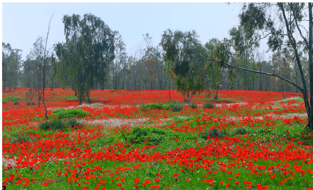
Hundratusentals turister kommer till västra Negev när anemonerna blommar.

Festivalen lockar numera cirka 300 000 besökare