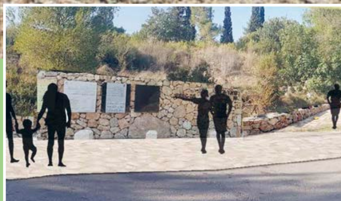
Raoul Wallenberg-parken tar form