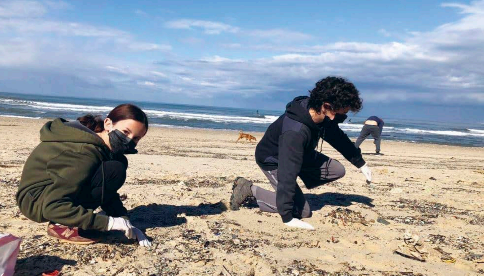
Hundratals Keren Kajemet-scouters utrustade med väskor, handskar och masker, ställde upp för att rensa Israels förorenade strandlinjer.