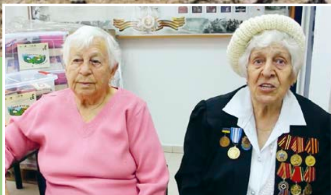
Stor glädje över matpaket från Sverige sid 5