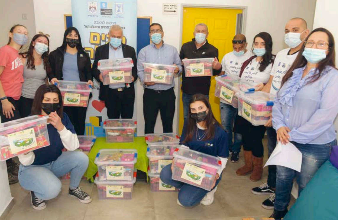
Volontärer och Keren kajemet-anställda inför matpaketutdelningen i samband med Purim.