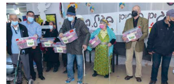
2000 matpaker som svenska understödare finansierat delades ut i samband med Purim-högtiden.

Keren Kajemet Sveriges uppdrag för att distribuera