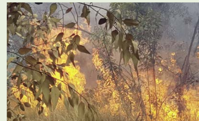
Sedan striderna mellan Israel och Gaza blossade upp i våras har ett dussintal brandballonger skjutits upp.

Mejl: info@kkl.nu , telefon: 08-661 86 86.