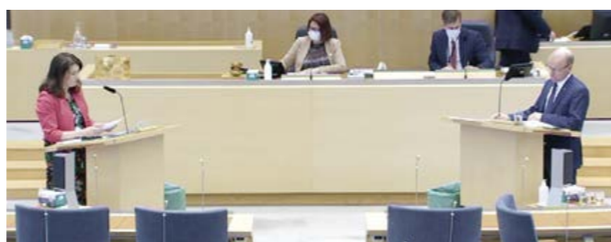
Utrikesminister Ann Linde och riksdagsledamoten Mikael Oscarsson debatterar UD:s agerande gentemot Raoul Wallenberg.

För att ge en översikt över det nya forskningsläget och titta närmare på skälen till de anhörigas önskemål inbjuder riksdagsledamoten Mikael Oscarsson (KD) till en hearing i riksdagen dagen före Raoul Wallenbergs dag den 27 augusti, där en rad nya upptäckter i Raoul Wallen-