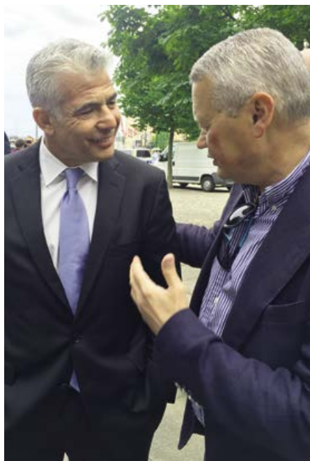
Max Federmann talar med Yair Lapid under en Israelmanifestation på Raoul Wallenberg torg i Stockholm 2016

Härav förstår man vilken betydelse varje räddad människa från ondskans krafter kan få långt in i framtiden. Samtidigt kan man fundera över vilken katastrof mordandet av sex miljoner judar fick för världen. Hur många framtida