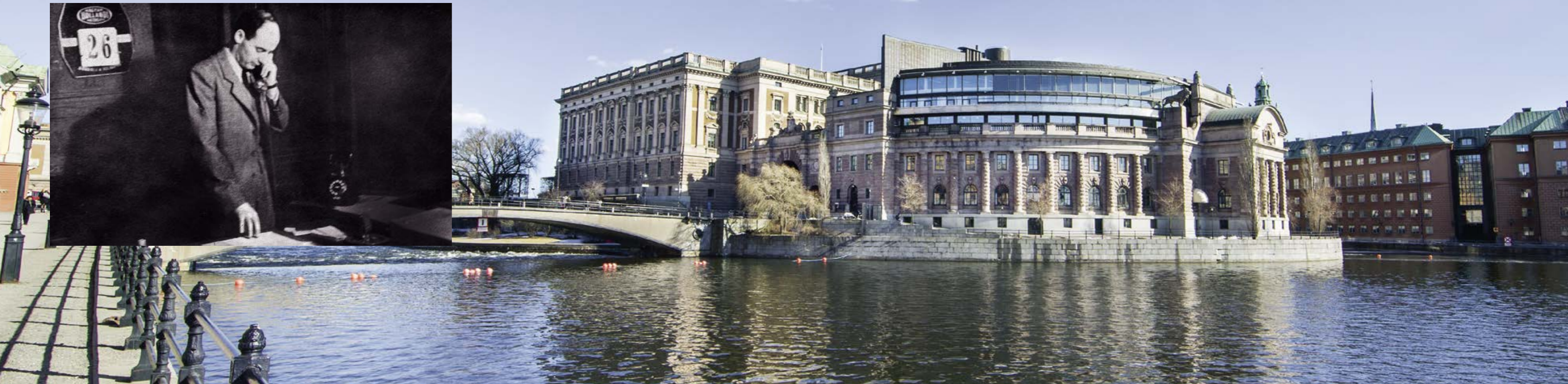
Den 26 augusti hålls en hearing i riksdagen om de nya forskningsrönen kring Raoul Wallenbergs öde. Seminariet kommer bland annat att ställa frågan om UD redan 1945-1947 fattade ett medvetet beslut att överge den svenska diplomaten åt sitt öde.