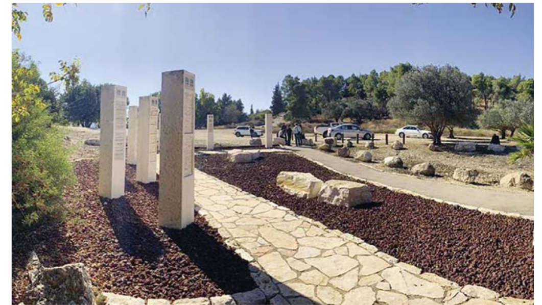
Du kan gravera in ditt namn i Raoul Wallenberg Park genom att donera 2 000 kronor till parken. Du får då ditt namn inskrivet i parkens hyllningsplatta "Vänner av Israel".

Kontakta oss på e-post info@kkl.nu eller tel 08-661 86 86 (kontorstid 9-12) vid frågor om plaketterna. □