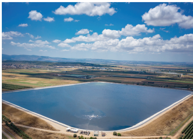
Shomrat-reservoaren i västra Galileen används för bevattning under den torra sommaren. Avloppsvatten i området behandlas och återvinns för att återanvändas i jordbruket.

Kunskapen om detta var något som alla israeler bar med sig i ryggmärgen. Vattennivån i Kinneret blev, under vissa