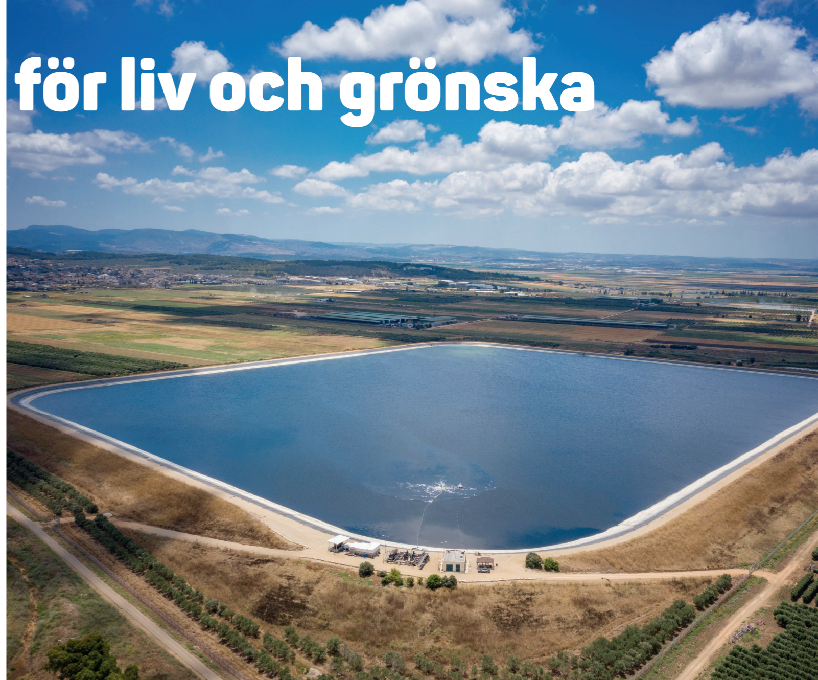
Shomrat-reservoaren öster om Kibbutz Shomrat byggdes av Keren Kajemet för att hjälpa de lokala jordbrukarna under den varma och torra årstiden. Reservoaren är en billig vattenkälla och hjälper till att skydda miljön genom att återanvända vatten.

Byggtekniken har förbättrats och blivit mycket mer effektiv och sofistikerad under åren som ett resultat