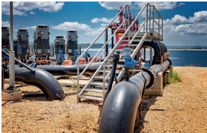
Reningsanläggning vid Shomrat-reservoaren.

Att låta vattnet förvaras i en sådan reservoar är en del