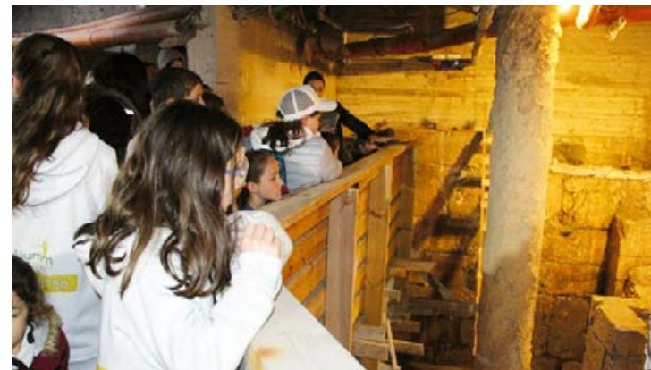
En av barnens första utflykter var till Gamla stan i Jerusalem.

Judiska barnflyktingar från Ukraina får via Keren Kajemet en fristad i Israel