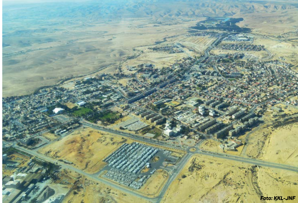
Yeruham har i dag drygt 10 000 invånare.