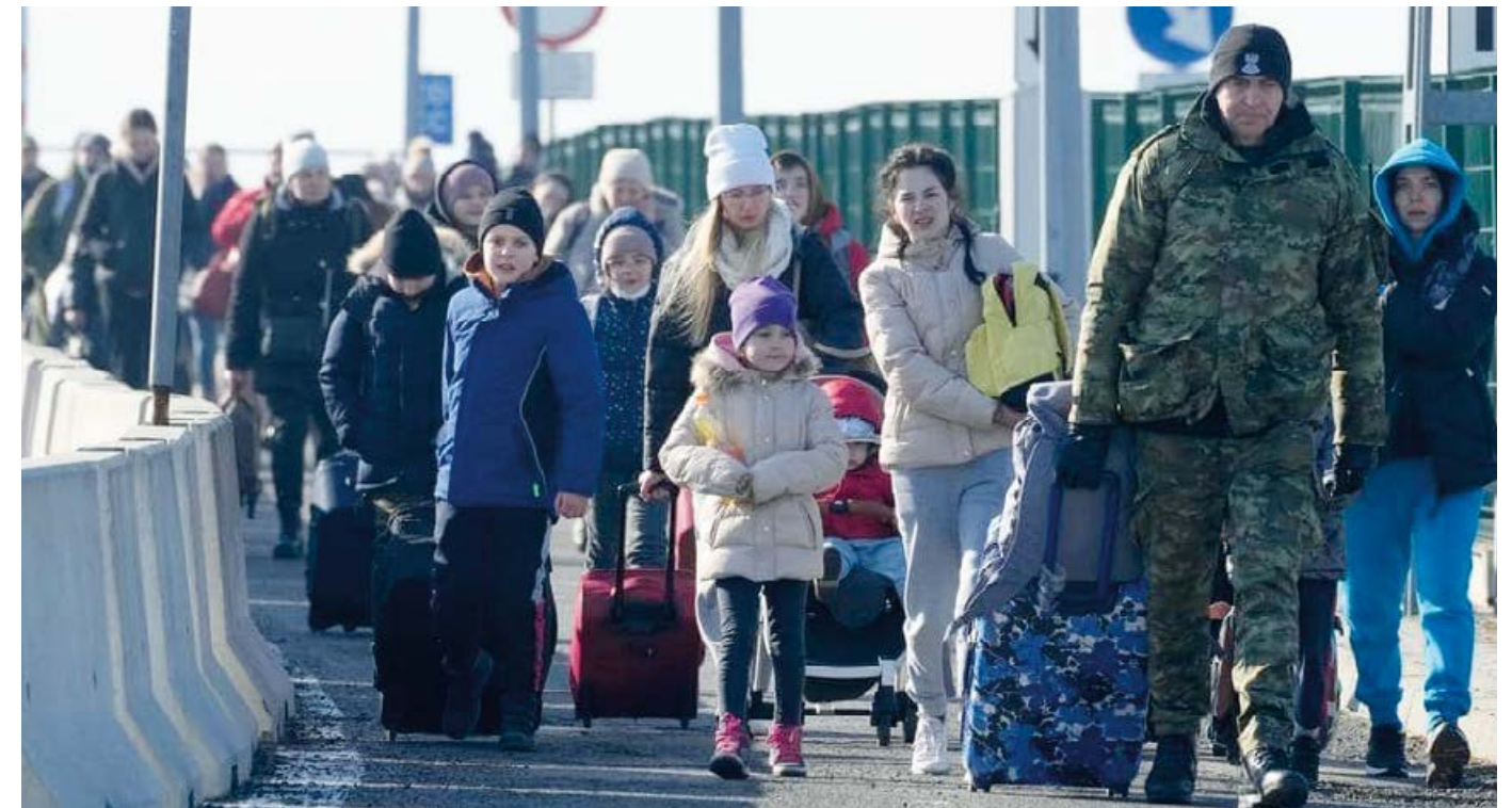
KKL har etablerat center i Ukraina, Ungern och Tjeckien för att hjälpa judiska flyktingar i Ukraina.

Efter en upprivande 10-dagars resa till fots från deras krigshärjade stad till staden Cluj i Rumänien, kom de om-