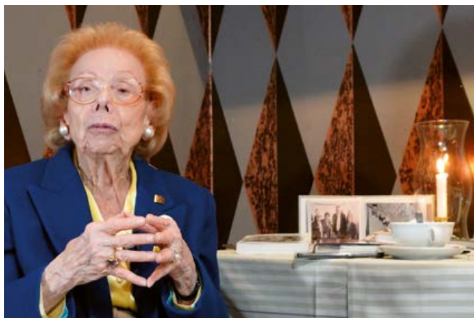
När hon nu fyller 90 år kan Kate se tillbaka på ett fullgott liv som präglas av nära familjeband och en lång och spännande karriär.

Att det nu finns krafter som förnekar att sex miljoner judar, varav 1,5 miljoner var barn,