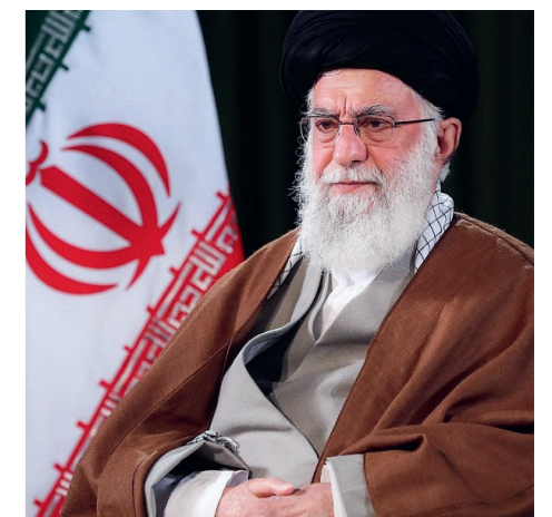
Irans ayatollah Ali Khamenei har ofta hotat med att förinta Israel.

Därför är Raoul Wallenberg Park och tillhörande digitala museum så betydelsefulla. Tack för att du hjälper oss att förverkliga dessa planer! □