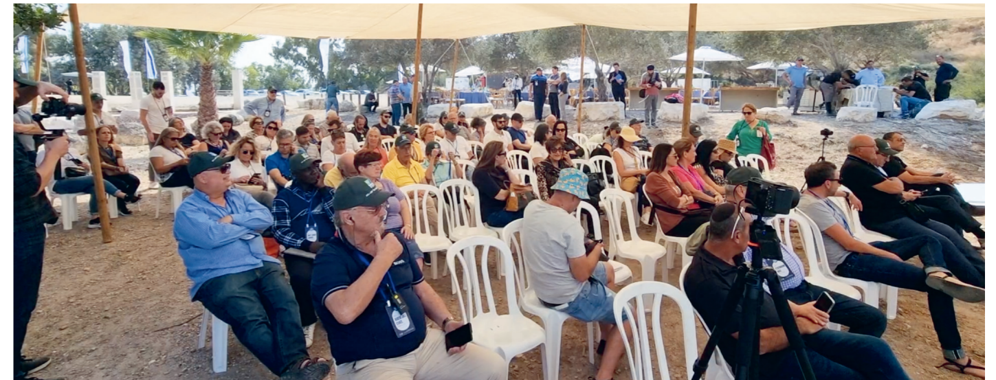
Delegater på Keren Kajemets världskongress besökte Raoul Wallenberg Park där de fick lyssna till ett föredrag om vikten av att lyfta fram Raoul Wallenberg i en tid då antisemitismen ökar och hatet mot den judiska nationen Israel eskalerar.

Lapid och hans svenske kollega Ann Linde hösten 2021.